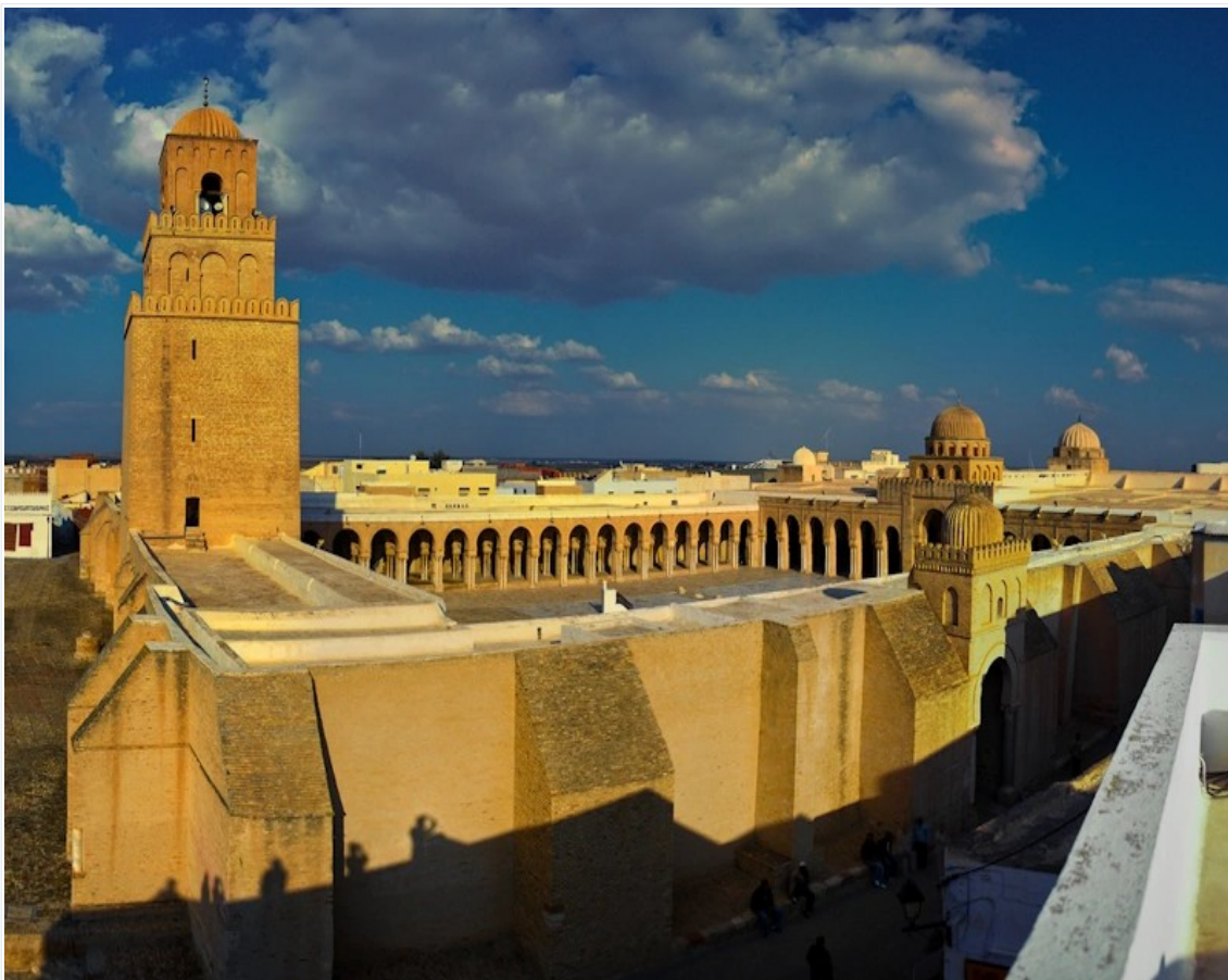
Vue de la Grande Mosquée de Kairouan, en Tunisie. Édifiée à partir du VIIe siècle, elle est la plus ancienne mosquée de l'Occident musulman.

Ce bref aperçu montre la diversité et l'interaction des civilisations autour de la Méditerranée au VIIe et VIIIe siècle, marquées par des conflits, des échanges culturels, religieux et linguistiques qui ont façonné l'histoire de la région.